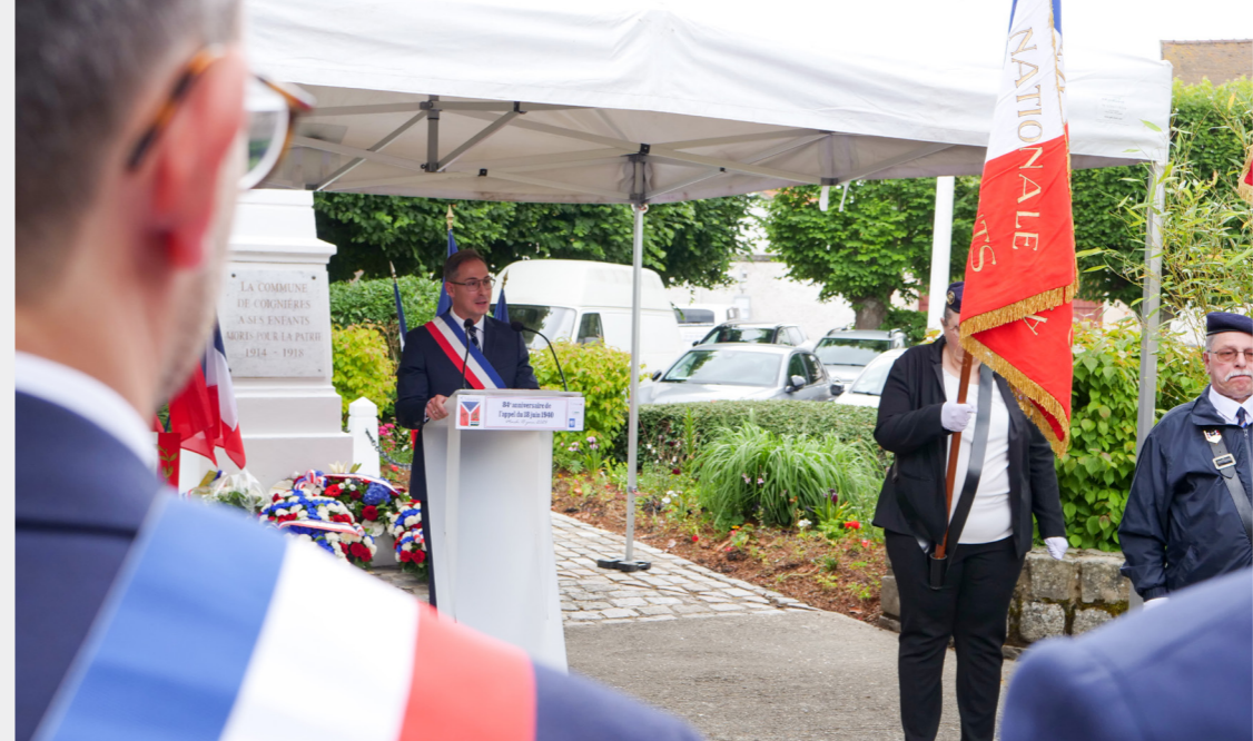
Le Maire prononce un discours lors de la cérémonie du 18 juin 2024.

Réponse : Accès inchangé. Création d'une liaison douce le long du chemin de Paris (emplacement réservé n° 20).