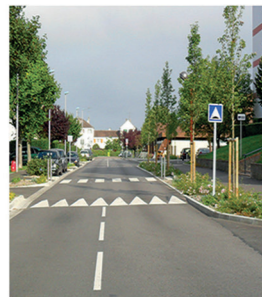
Square du Mâonnais