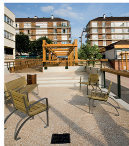
Place du marché